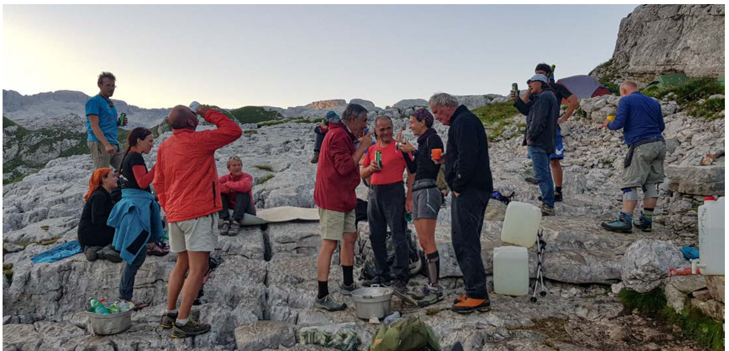
Poslednji večer so nas obiskali veterani, vedno veselo snidenje.

Špela in Jure sva šla spet v LJ-29. Najprej sva se na dnu jame odločila, da sva imela glede prepiha oba prav (zelo diplomatsko!). Prepih res pride z dna, ampak gre v en precej obupen šoder. Izvor prepiha sva locirala z eksperimentom z