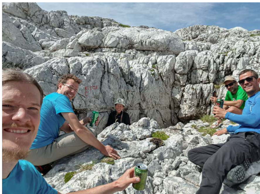
Levo: vesela mladinka po prvi izkušnji Kanina. Zgoraj: nadzor evaluiranja perspektivnosti zimskih dihalnikov na trasi P4-MB.

smo se odločili, da jutri opremimo šaht, in potem smo se vrnili v tabor. Ko sta se taboru pridružili Beki in Ester, smo za večernim omizjem ugotovili, da smo tabor prevzeli še-ne-tridesetletnice in ne-tridesetletniki. Povprečna starost je bila 23 let. Peter