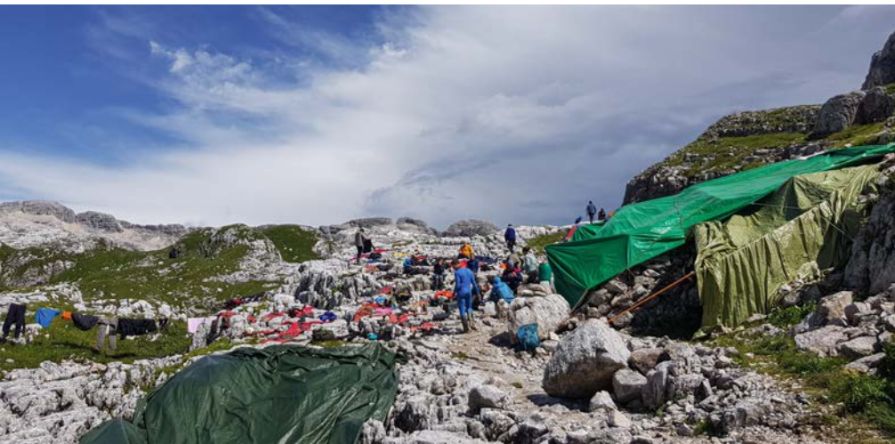
Klasična scena 2020: sušenje premočenih oblačil, nadzor vremena v čakanju naslednje plohe in bazen z razgledom.

katero je Špela skušala neuspešno razložiti naslednji ekipi, kaj vse je treba preopremiti]